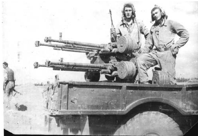
Июль 1981 года. Четырехствольный ДШК. Трофей, отбитый у духов.

Славные традиции полка, доблесть и мужество прояви-